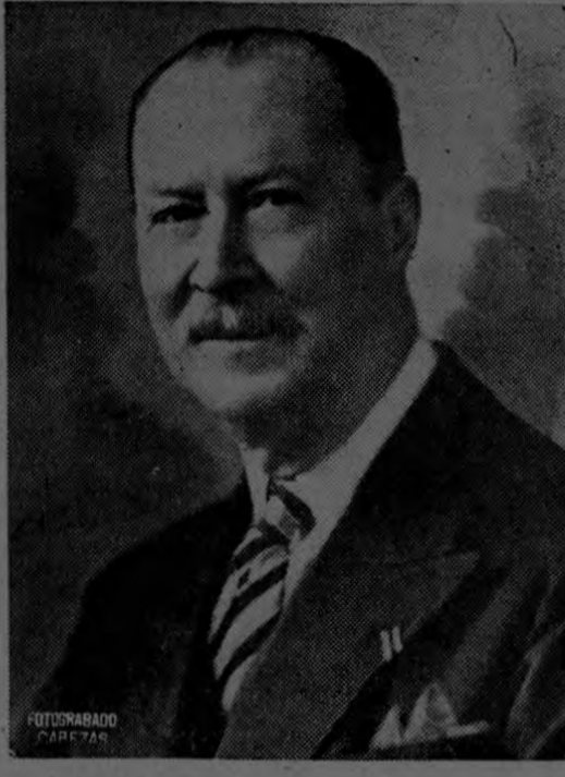
Manuel González Zeledón (Magón) Famoso costumbrista costarricense