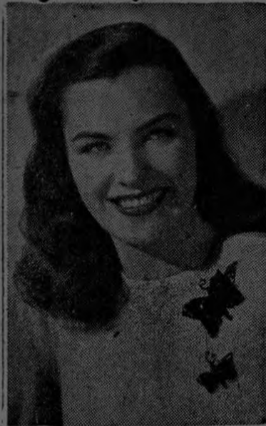
La adorable ELLA RAINES , es una de las poquísimas actrices de Hollywood a quienes el famoso maquillista Max Factor Jr. clasifica "Modelo", es decir, un tipo de rara belleza femenina, como los que se ven en las revistas de modas.

figura no se parece a la de esas modelitos, adaptan a su figura los vestidos que ven en las revistas, nunca tratando de duplicarlos en todos sus detalles.