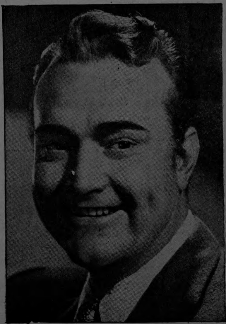
RED SKELTON... ASTRO CO MICO DE LA METRO GOLD- WIN - MAYER

Según dice Red Skelton, él siem- pre ha estado interesado en los se- res humanos y este interés ha da- do su fruto, ya que muchos de sus